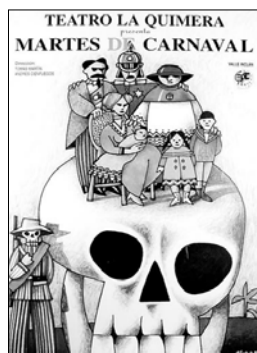
Una obra de teatro de La Quimera.