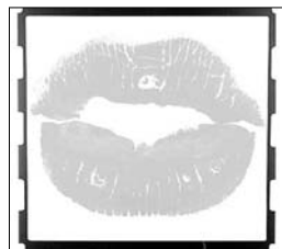
Los labios de Seminci, obra de Sierra.