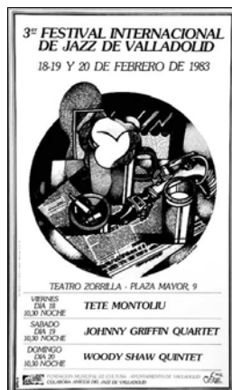
Cartel del desaparecido festival de 'jazz'.